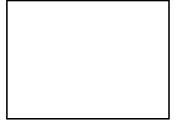
Tablo 8 Okul Yönetici Sayıları