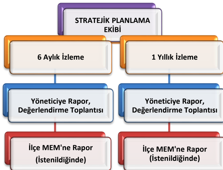
Şekil 8 Stratejik Plan İzleme ve Değerlendirme Modeli

Müdürlüğümüzün 2024-2028 Stratejik Planı İzleme ve Değerlendirme sürecini ifade eden İzleme ve Değerlendirme Modeli hazırlanmıştır. Okulumuzun Stratejik Plan İzleme-Değerlendirme çalışmaları eğitim-öğretim yılı çalışma takvimi de dikkate alınarak 6 aylık ve 1 yıllık sürelerde gerçekleştirilecektir. 6 aylık sürelerde Okul Müdürüne rapor hazırlanacak ve değerlendirme toplantısı düzenlenecektir. İzleme-değerlendirme raporu, istenildiğinde İlçe Milli Eğitim Müdürlüğüne gönderilecektir.